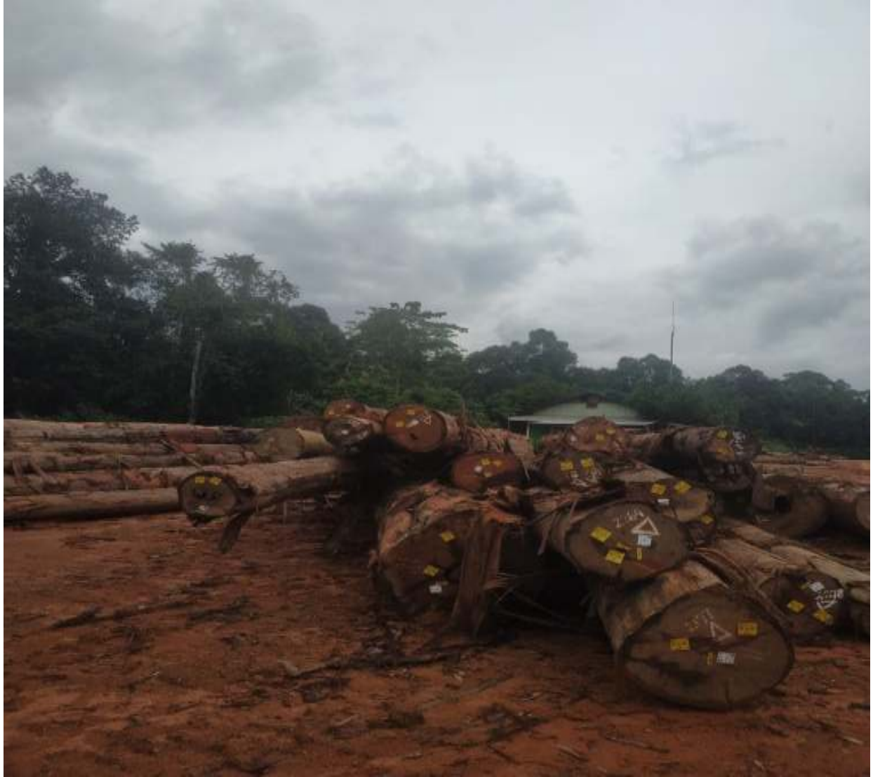
Gambar : 4. Log di TPk KM 21