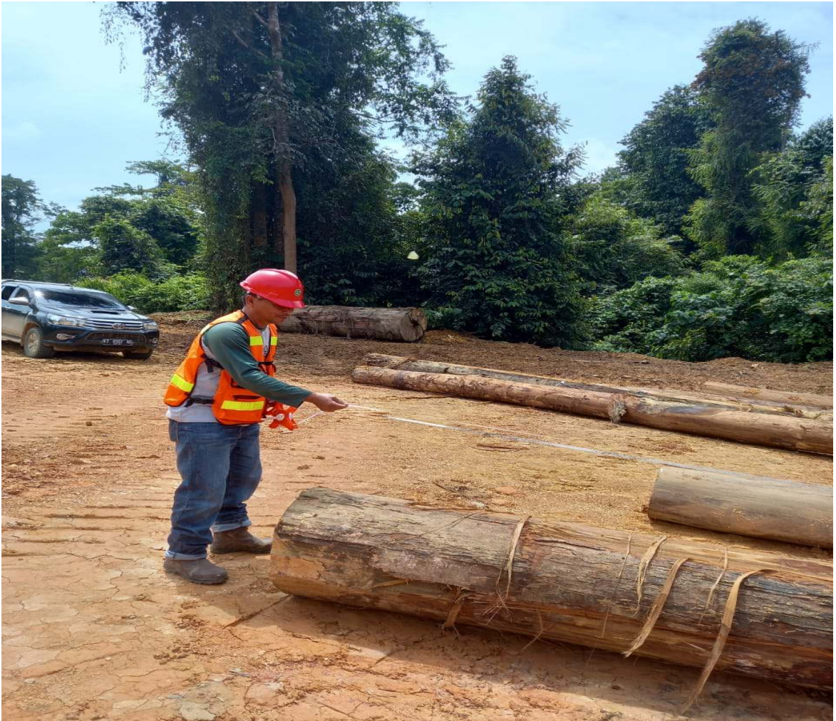
Gambar : 1. Pengukuran di Tpn Blok

Ada beberapa Kegiatan yang ada di bidang TUK antara lain: