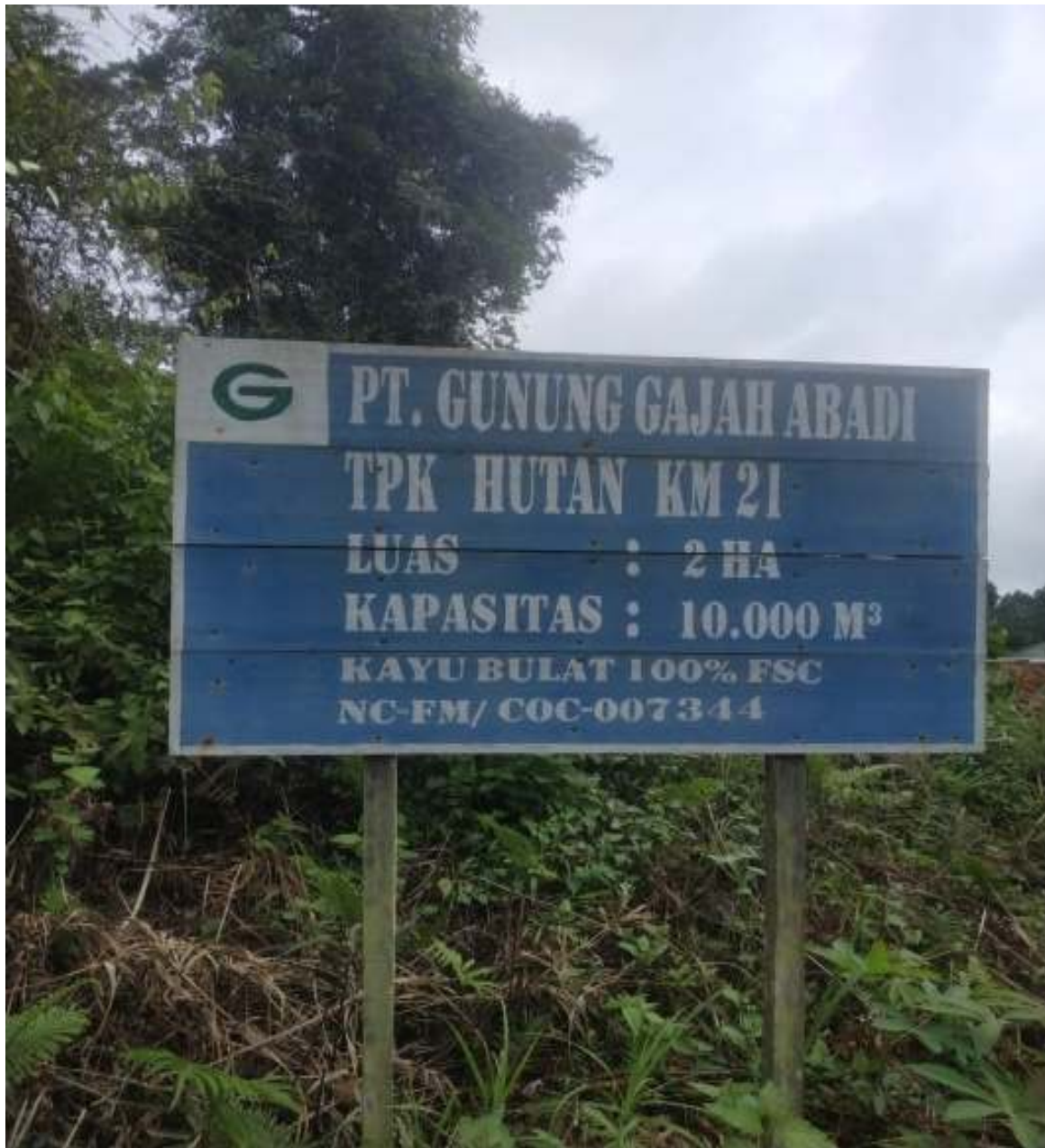
Gambar: 3. Plang TPK Hutan KM. 21