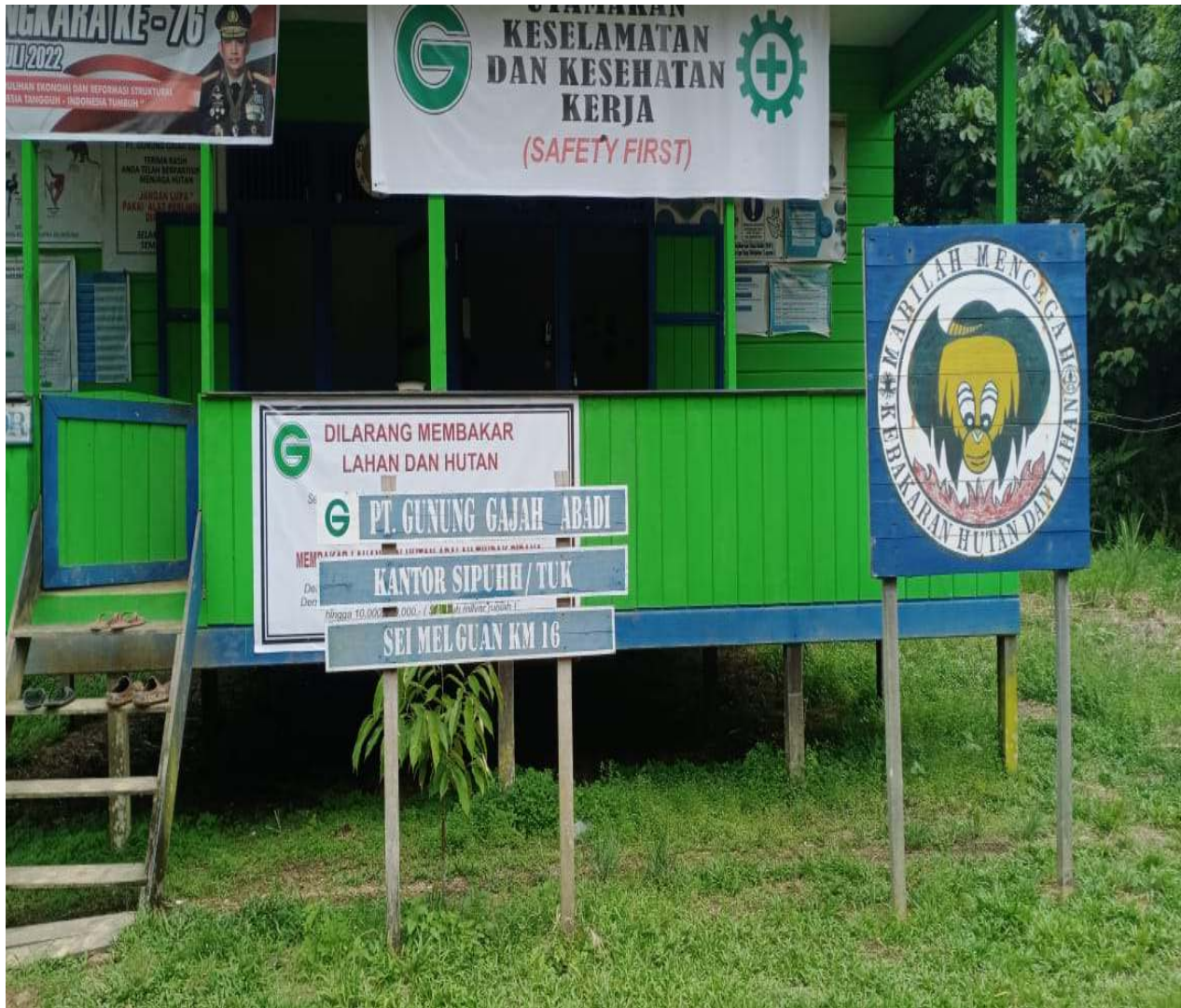
Gambar : 5. Kantor administrasi di km 16, untuk penerbitan dokumen sistem online (SIPUHH)