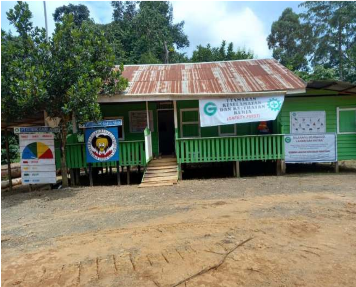
Gambar: 2. Kantor administrasi TPK Hutan KM 21 untuk pembuatan dokumen SKSHHK