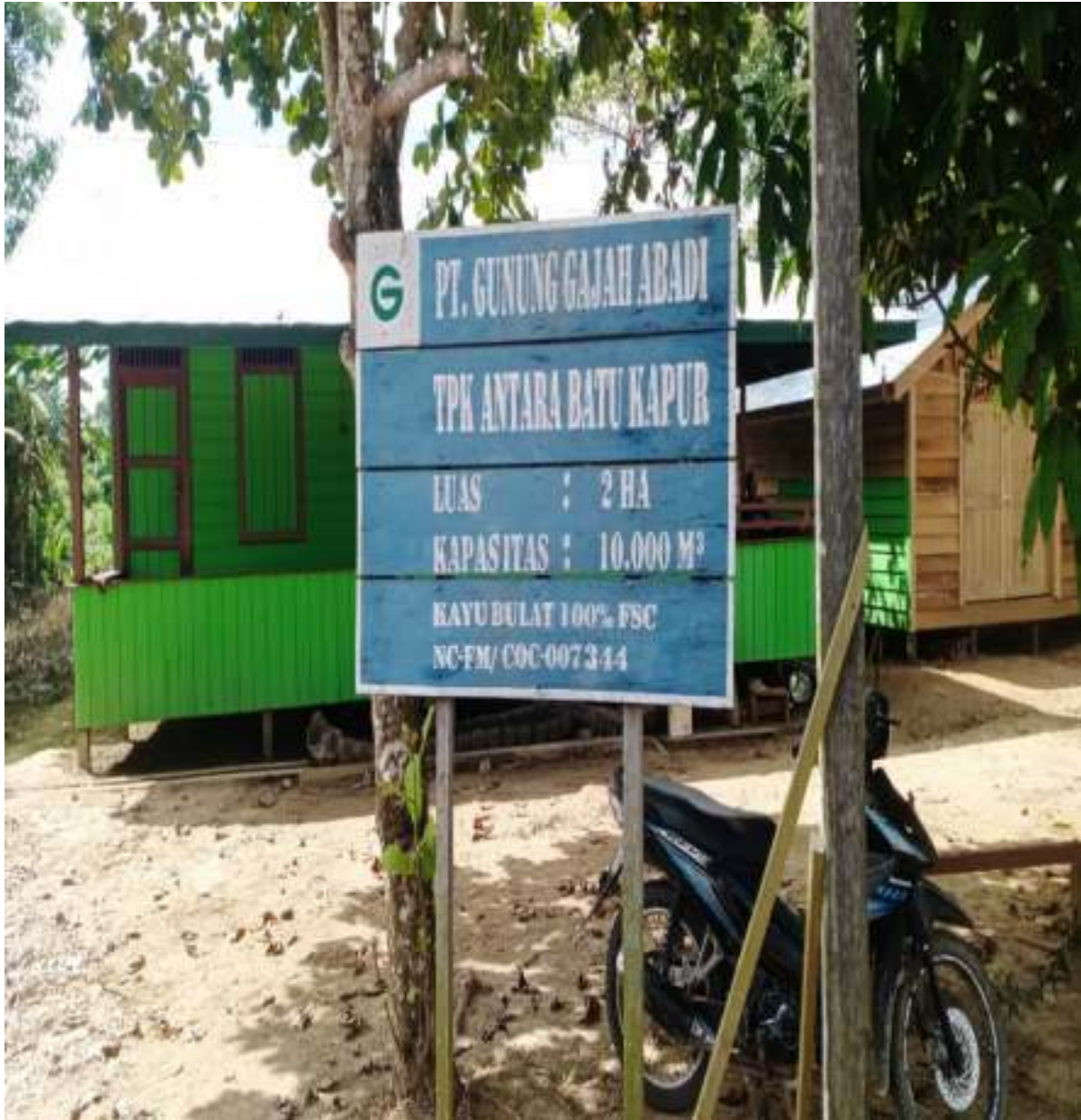
Gambar : 7. TPK Antara yang berada di Batu Kapur